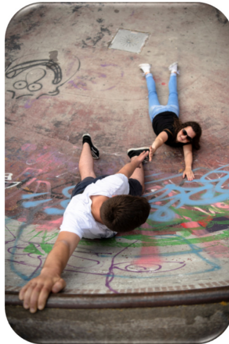
Dein Spiel am Limit