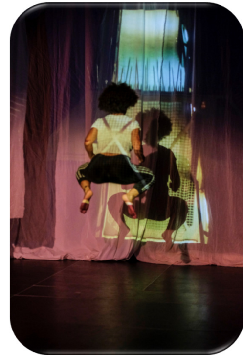
Ich habe einen Traum