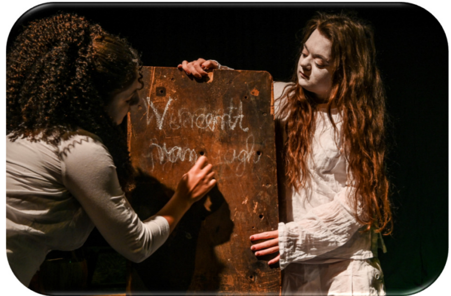
Schwefelgelb – ein Stück Sehnsucht