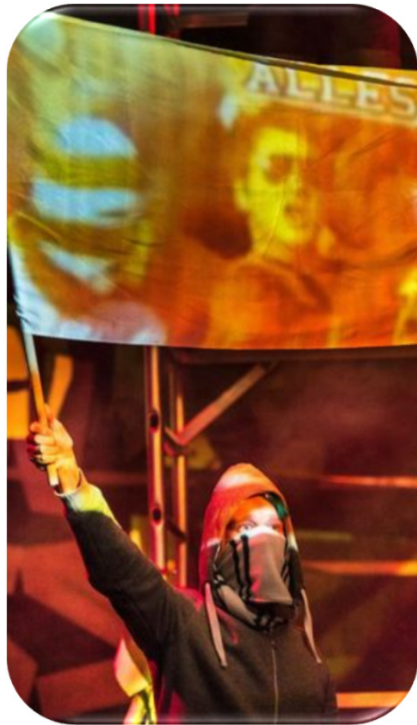
Wir gegen die Anderen