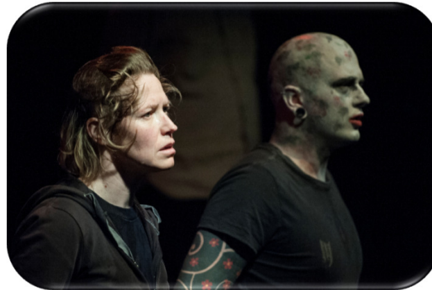
17 ½ Minuten kalte Wut