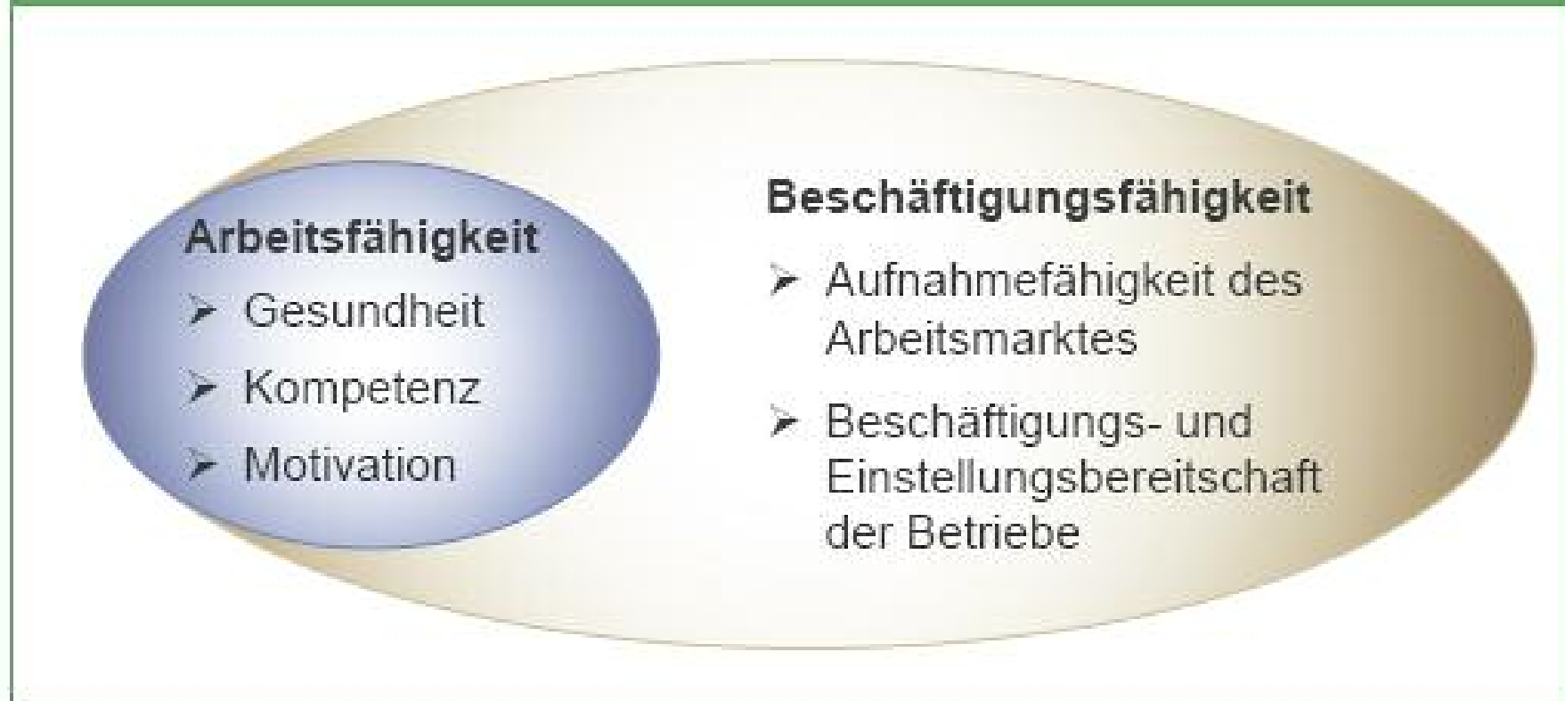
Abb. 3: Voraussetzungen für eine längere Erwerbstätigkeit von Älteren