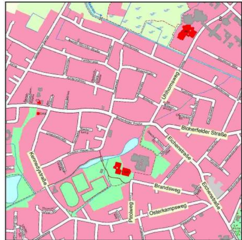
Stadtteil Bloherfelde / Eversten

(Grundlage ist der Setting-Ansatz der WHO)